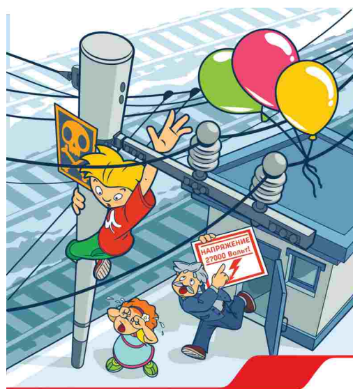
Приближаться к проводам меньше чем на 2 метра – смертельно опасно!

Иллюстрация – авторская разработка ООО «РЖД» и является объектом интеллектуальной собственности ООО «РЖД». Все права защищены. Любое использование без разрешения ООО «РЖД» запрещено. Контакт: 800-700-0000. Контактный центр «РЖД» работает по адресу: Москва, ул. Мясницкая, д. 10/12. Контактный центр «РЖД» работает по адресу: Москва, ул. Мясницкая, д. 10/12.