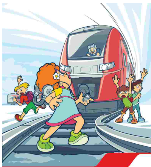
Сними наушники и капюшон при переходе железнодорожных путей! Они мешают заметить поезд!

Иллюстрация – авторская разработка ООО «РЖД» и является объектом интеллектуальной собственности ООО «РЖД». Все права защищены. Любое использование без разрешения ООО «РЖД» запрещено. Контакт: 800-700-0000. Контактный центр «РЖД» работает по адресу: Москва, ул. Мясницкая, д. 10/12. Контактный центр «РЖД» работает по адресу: Москва, ул. Мясницкая, д. 10/12.